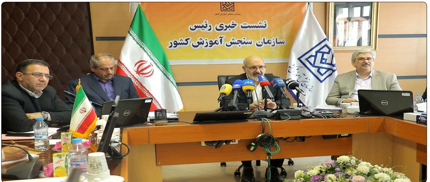
نشست خبری رئیس سازمان سنجش آموزش کشور