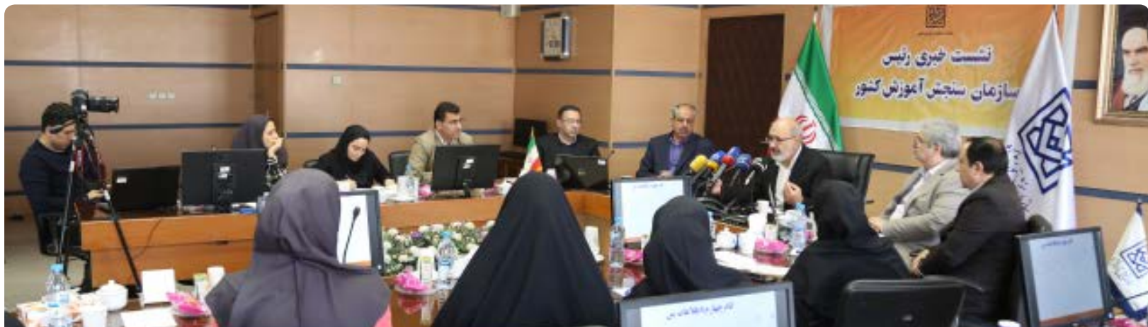
رئیس سازمان سنجش آموزش کشور تشریح کرد