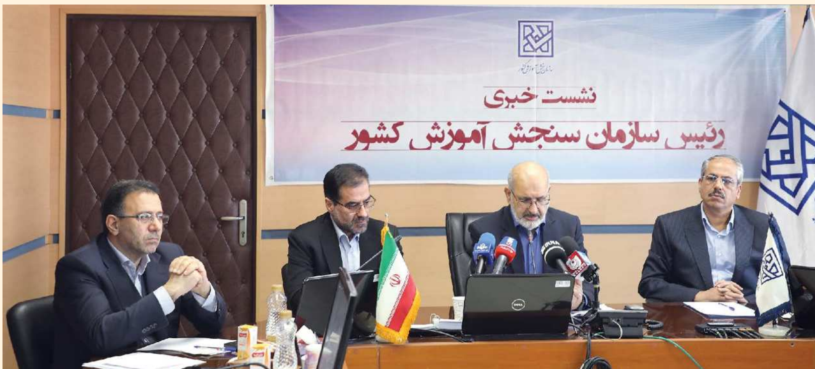
رئیس سازمان سنجش آموزش کشور اعلام کرد