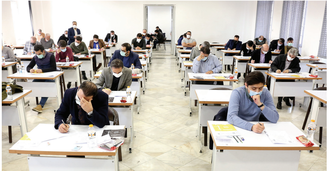
رئیس سازمان سنجش: